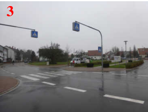
Dieser Zebrastreifen sollte genutzt werden.