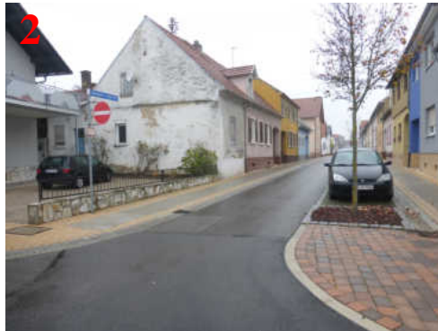
Achtung: Hier fehlt eine Überquerungshilfe!