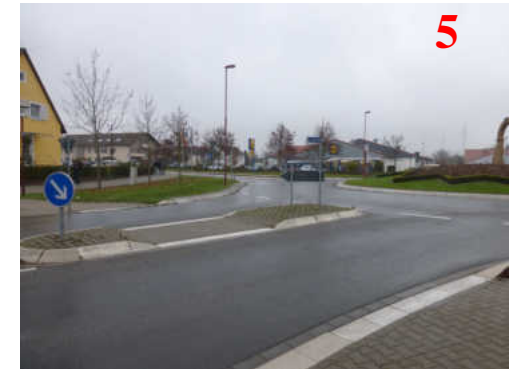
Achtung: Hier biegen viele Busse und PkW ab!