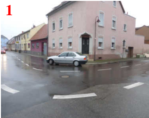
Achtung: Hier biegen viele Lkw und PkW ab!