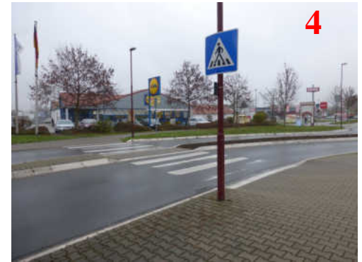
Dieser Zebrastreifen sollte genutzt werden.