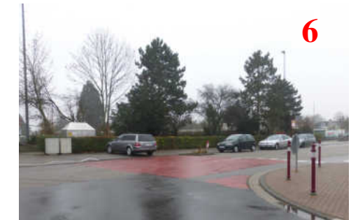
Hier parken oft Autos den Überweg zu!